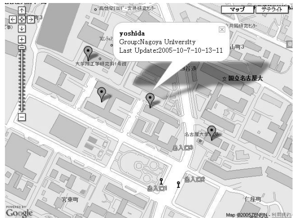
図4 登録したユーザの位置情報リアルタイム表示例

本サービスの応用として、マップ上にメッセージ等のオブジェクトを埋め込むことを考えている。自身の行動範囲に作業等のメモを記録する利用方法や、事故情報や工事情報等の進行方向に問題がある場合の予告としての利用方法等、位置と共に時間にも依存したサービス[5]が考えられる。また、ユーザの作成した、より詳細な地域マップを埋め込むことによる、地図機能の向上も考えている。