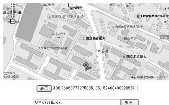
図 2 地図サービスからの位置情報の取得